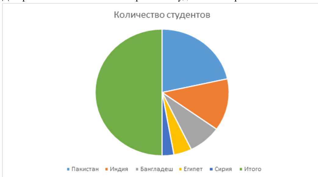
Таблица 1. Распределение иностранных студентов по странам (на 01.11.2025 г.)